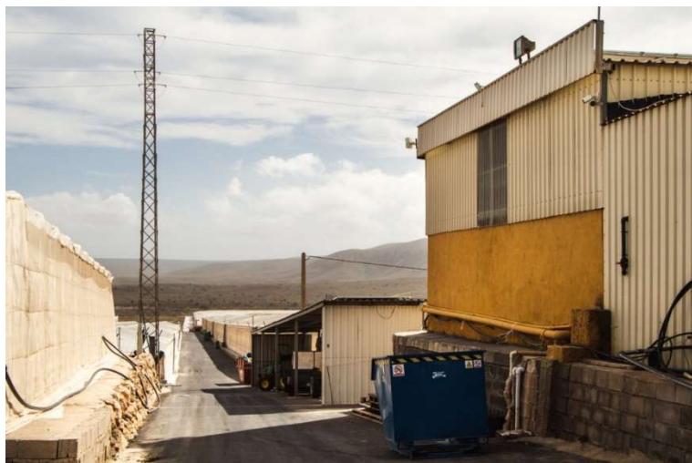
Drivhuslandskap med nasjonalpark i bakgrunnen.

I tillegg til de metodiske svakhetene ved GRASP-revisjon er det også grunn til at norske selskaper burde ta en vurdering av hvilke arbeidsrettighetsrevisorer de benytter i Almería.