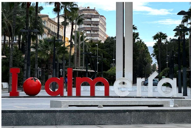
Offentlig kunstverk i sentrum av Almería by med en stilisert tomat i stedet for et hjerte.

I drivhusene produseres det året rundt. Men den mest intensive perioden er på vinteren, når det er mindre konkurranse fra europeiske lands egenproduksjon. Europeiske forbrukere foretrekker å spise grønnsaker fra sitt eget land når det er i sesong, men importerer utenfor sesong for å ha tilgang til ferske produkter. 33