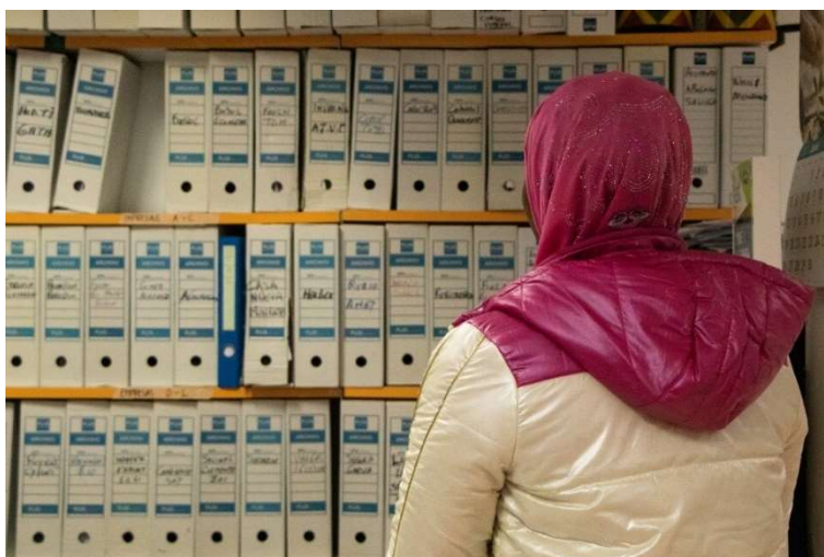
En av de Nordafrikanske drivhusarbeiderne vi intervjuet.

Flere drivhusarbeidere forteller at de ofte blir utskjelt av sjefene sine. De sier de har blitt kalt «udugelige», «esler», og at de generelt snakkes til uten respekt. Dette ble beskrevet av en av interesseorganisasjonene for migranter vi intervjuet som spesielt tungt for migrantarbeidere, fordi disse ikke har et stort sosialt nettverk i Spania. De er stort sett enten på jobb