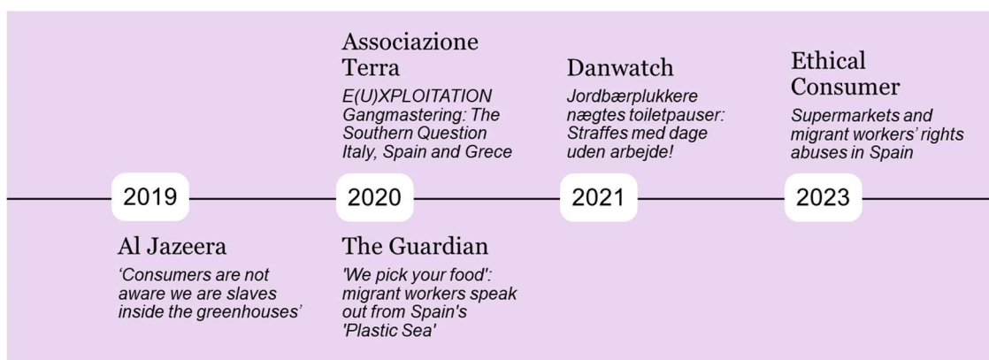
Figur 2: Tidslinje over noen tidligere rapporter om rettighetsbrudd i det sør-spanske jordbruket.

Utfordringer med arbeidsforholdene i jordbruket i Sør-Spania har vært diskutert i mange omganger: