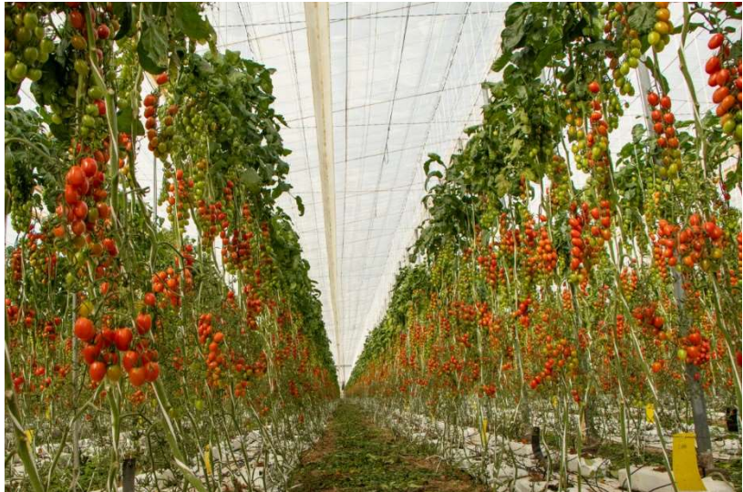
Modne tomater hang klare til innhøsting og eksport til Nord-Europa da vi var på besøk i november.

Én uke i forkant av reisen tok vi også kontakt med Coop og Bama for å høre om de kunne organisere besøk til sine produsenter. Bama sa de ikke rakk å gjøre dette på så kort frist, men vi fikk på egenhånd organisert besøk til flere ved å bruke leverandørlisten overlevert som svar på første informasjonskrav. Coop hadde mellom vår første henvendelse i mars og vår reise i november sluttet å kjøpe tomater fra Almería, og hadde på det daværende tidspunktet ingen slike leverandører i provinsen. Coop forsøkte å organisere et besøk til sin nærmeste leverandør i Alicante, men sendte oss feil møtetidspunkt så dette besøket bortfalt.