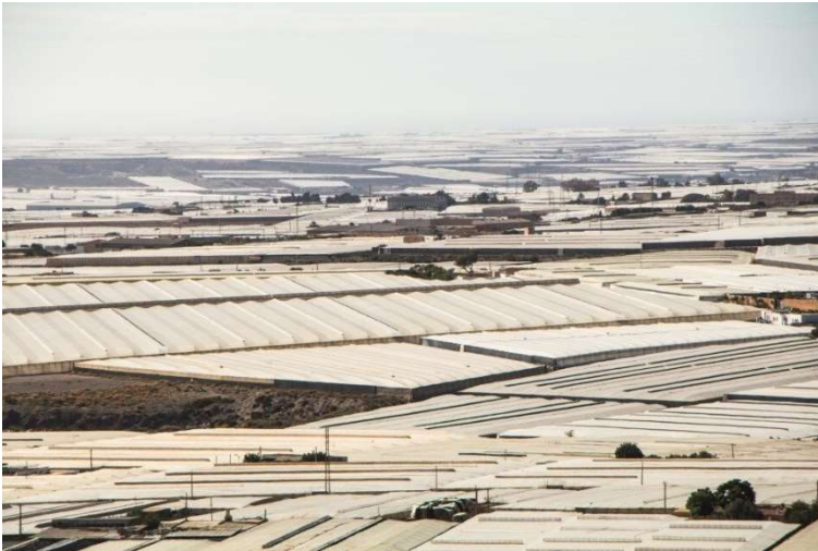
Området El Ejido i Almería, kalt "Plasthavet".

Langs middelhavskysten i Almería foregår stortilt eksportproduksjon av frukt og grønt under et tak av over 400 kvadratkilometer plastdrivhus, også kalt «Plasthavet». 28 Her finnes gode arbeidsforhold med fagorganiserte arbeidere og ressurseffektiv produksjon ved siden av gårder med lovbrudd der utnyttede og underbetalte migrantarbeidere jobber i farlig høye temperaturer med manglende beskyttelsesutstyr mot sprøytemidlene som brukes. Situasjonen kritiseres blant annet av Olivier De Schutter, FNs spesialrapportør på menneskerettigheter. 29