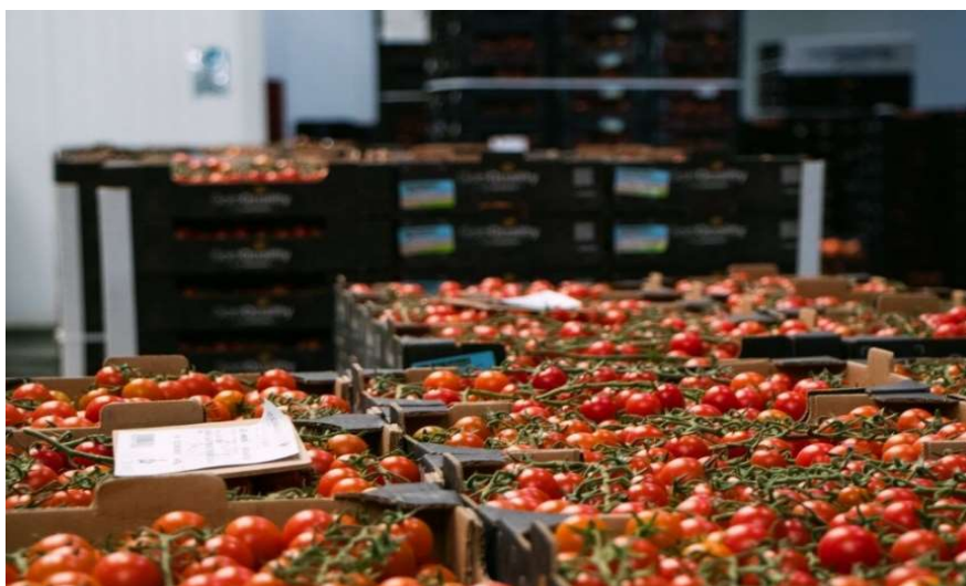
Klasetomater på et pakkeri i Almería, klare for eksport.