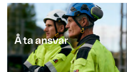
Å ta ansvar

Med driv og nysgjerrighet utfordrer vi etablerte sannheter. Vi leter alltid etter nye muligheter, mens vi lyser opp veien for andre.