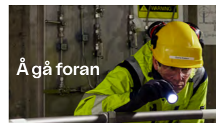
Å gå foran

Verdiene setter en ambisjon for vår kultur, og de er viktige byggeklosser for å etablere og utvikle en felles identitet på tvers av konsernet. Verdiene peker på hva som er grunnleggende verdifullt for Å Energi. De gir retning, skaper engasjement og en følelse av tilhørighet. Målet er at alle ansatte skal kjenne seg igjen i dem og vise det ved å leve ut verdiene i hverdagen.