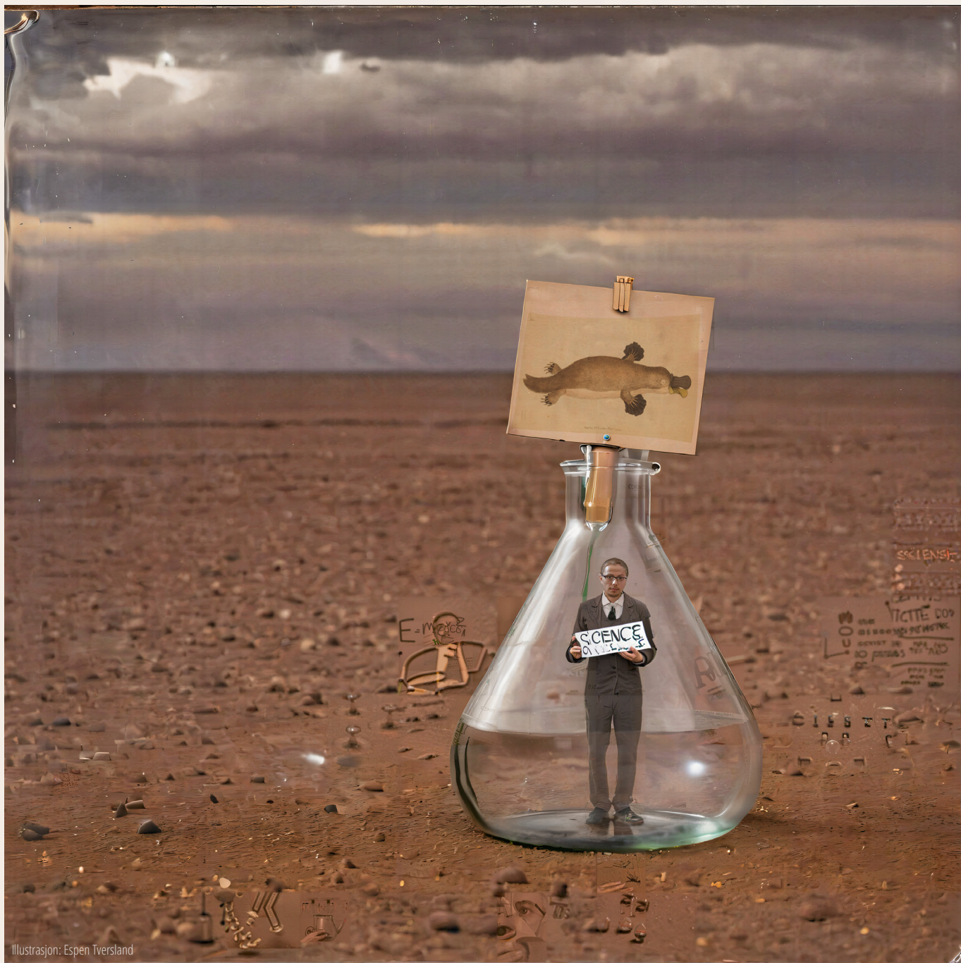
Illustrasjon: Espen Tversland