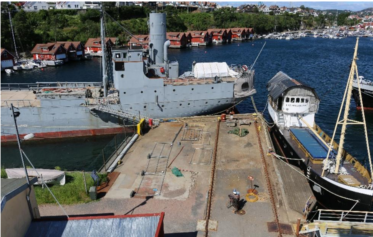
Bredalsholmen verft. Kristiansand.

De aller fleste større fartøyer er eid eller forvaltet av organisasjoner og lag. Deler av arbeidet med istandsetting er finansiert av det offentlige, men samtidig er det viktig å anerkjenne den betydelige innsatsen mange frivillige gjør i denne sektoren. Dette gjelder både vedlikehold