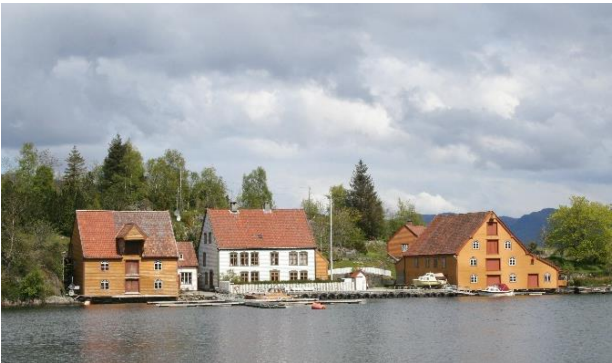
Rugsund Handelssted og gjestgiveri.

Langs hele kysten finnes gravrøyser og gravhauger fra jernalder og bronsealderen. Disse kulturminnene har ofte hatt en funksjon som seilingsmerker langs leia. I områder der landhevingen har tørrlagt eller gjort vannveien for smal for dagens fartøy, kan den forhistoriske leden fortsatt spores i plasseringen av de gamle kystrøysene. Ofte knytter det seg sagn, historier og lokal tradisjon til slike kulturminner som er viktige å ta vare på. Spor etter bosetning, gårdsbruk, markeds plasser og naust er i dag en viktig del av det maritime kystlandskapet.