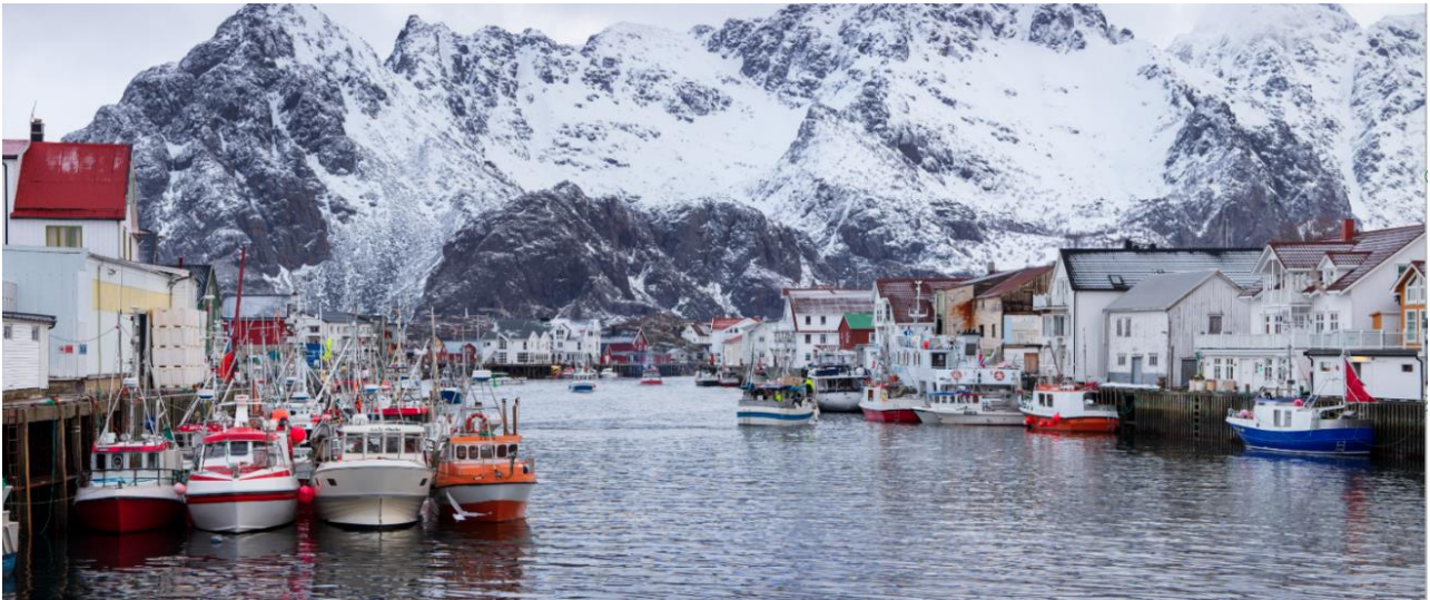
Fiskeværet Henningsvær.

Kystens kulturmiljø omfatter et mangfold av kulturminner og kulturmiljø som spenner fra de eldste sporene etter bosetning langs kysten og frem til vår tid. Her kan nevnes steinalderlokaliteter, kystroyser, uthavner, handelsplasser og fiskevær med kulturlag i havneområdene, skipsvrak, sjøhus, naust, fartøy og båter, bygninger etter fiskerbønder og strandsittere, fyr og seilingsmerker, kaier, støer og vorrer, uthavner og fiskevær, handelssteder og anløpssteder for kystruter, fritidsbebyggelse og badeanlegg, ulike kulturlandskap og forsvarsverk.