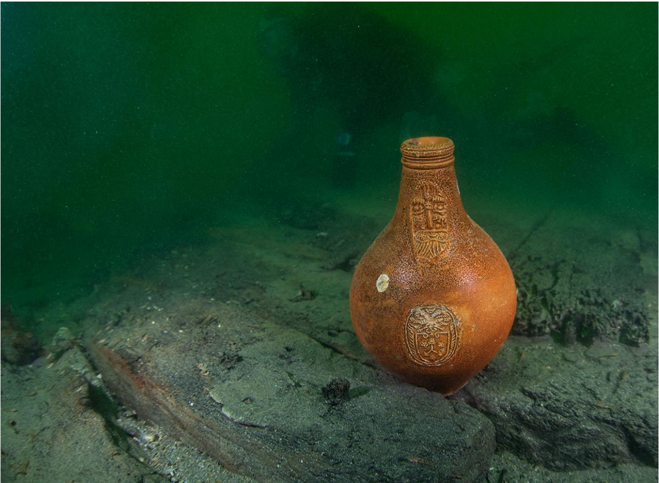
Bartmannskrukke fra skipet "Pelikanen" som sank i 1697.