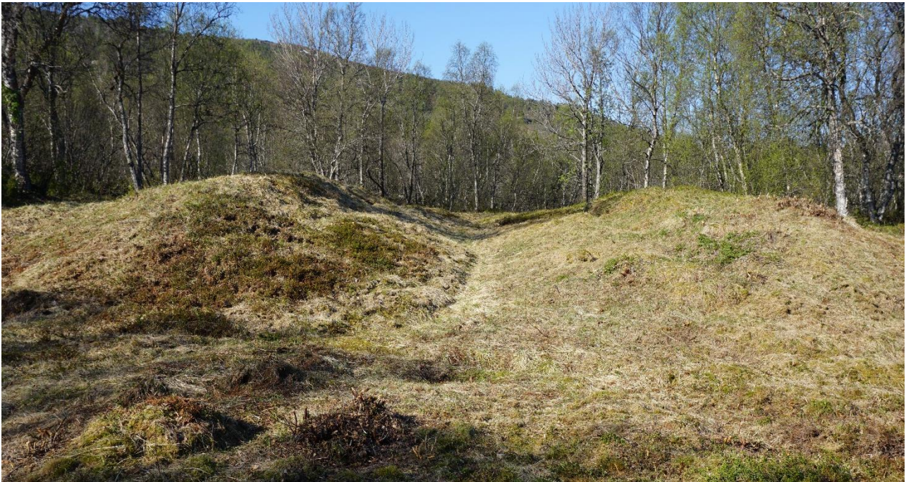
Forhistorisk eller middelaldersk nausttuft, Tjeldøya, Troms.

Det er viktig å bygge opp og sikre videreføring av relevant håndverkskompetanse og kapasitet som skal til for å kunne ta vare på både bygninger og fartøy.