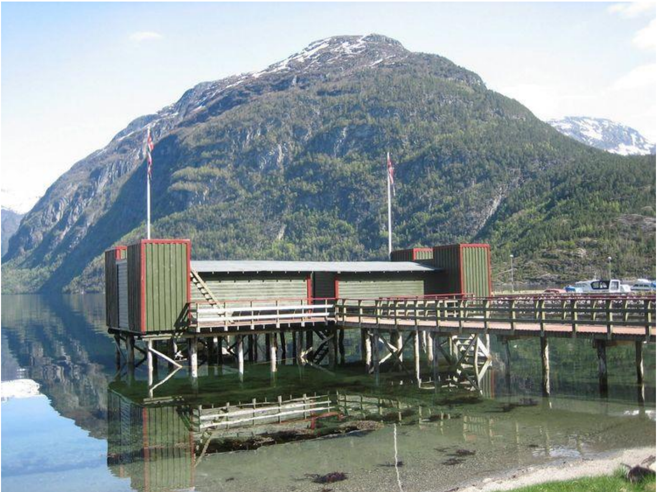
Hellesylt Sjøbad i funksstil fra 1930-tallet.

Byggingen av sjøbad skjøt fart på slutten av 1800-tallet, og det ble i tiden fram til mellomkrigsårene etablert en rekke slike. Sjøbadene var ofte store anlegg med hvilerom, omkleddingsrom, trapper ned til sjøen, stupetårn og brygger. Fra samme tidsepoke har vi også de mange private, små badehusene, med de tilsvarende funksjoner.