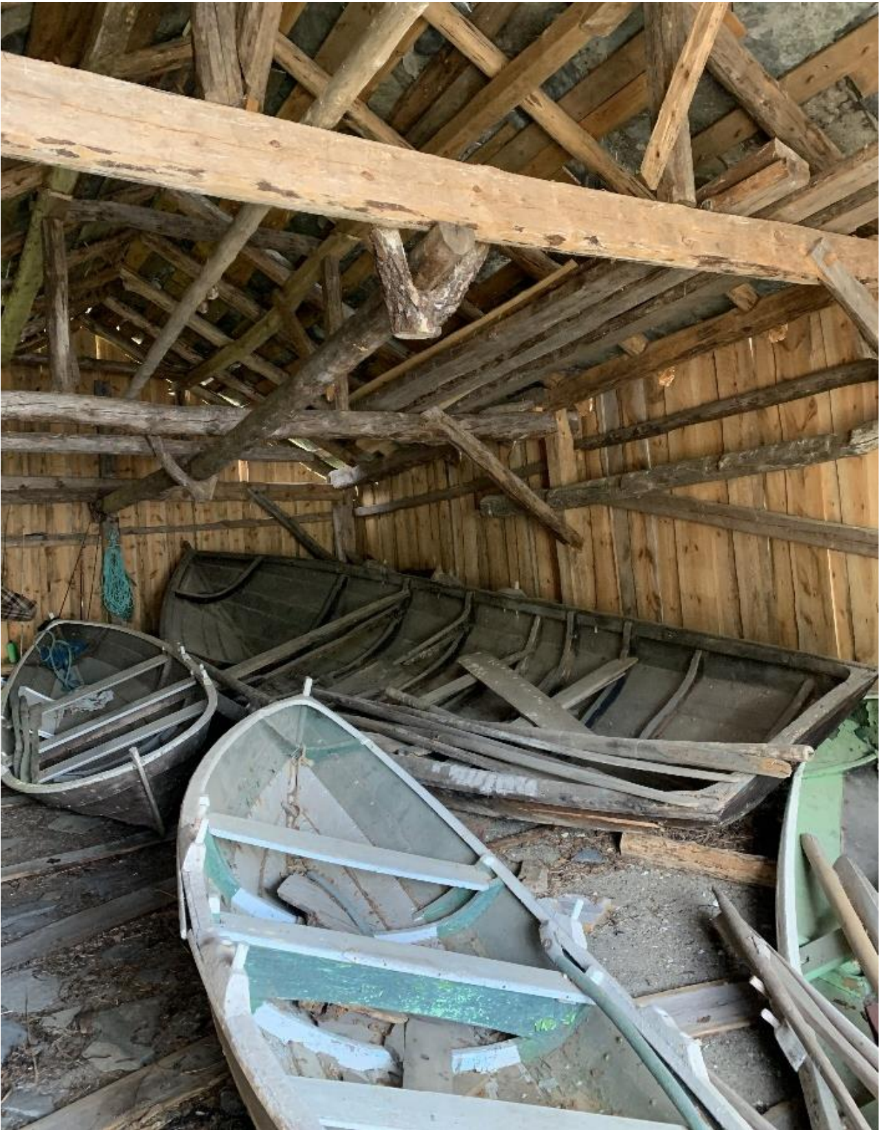
Naust i Ryfylke med flere åpne båter. Deriblant en kirkebåt.