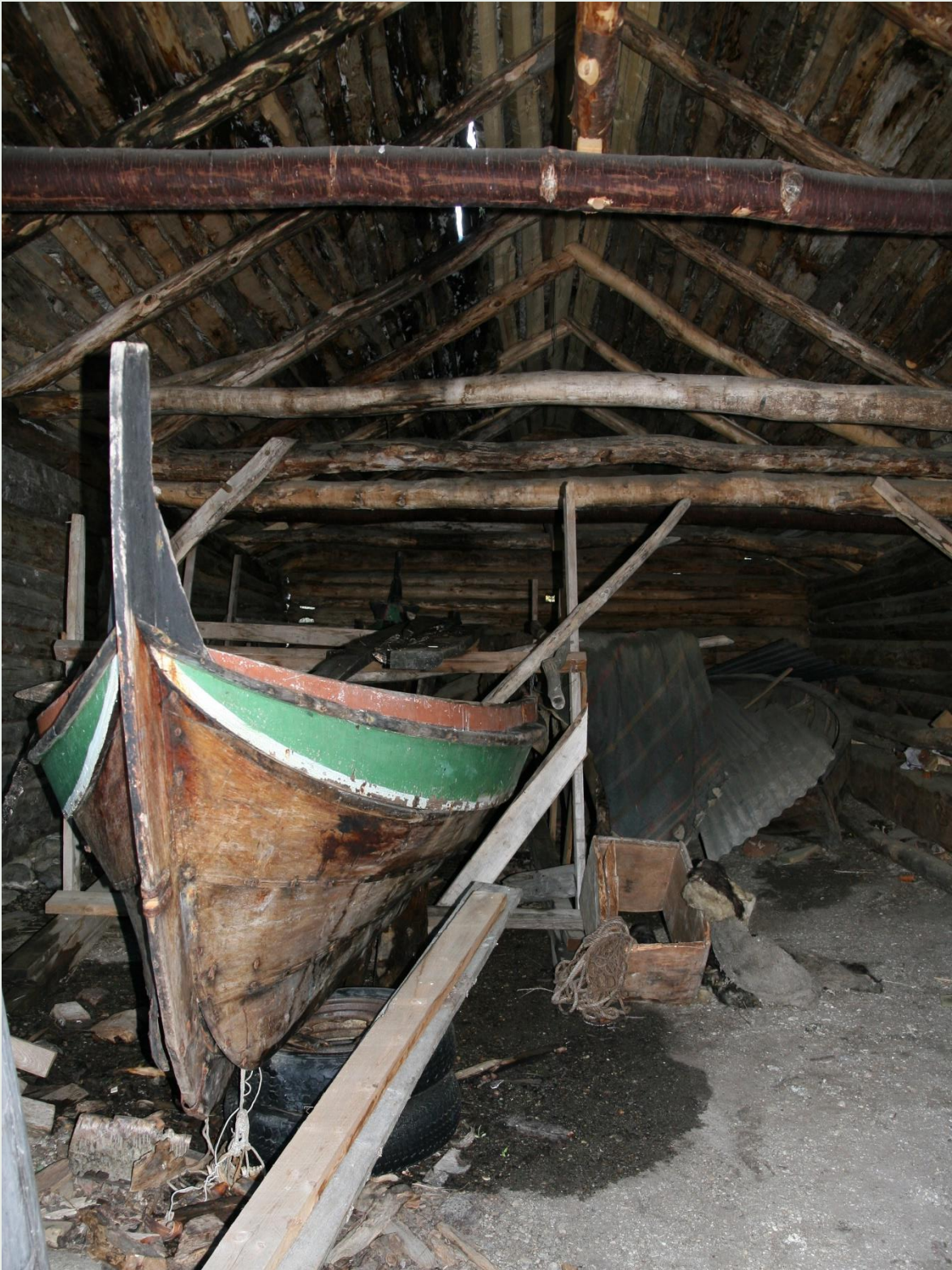
Misvær. Nordlandsbåt i naust.