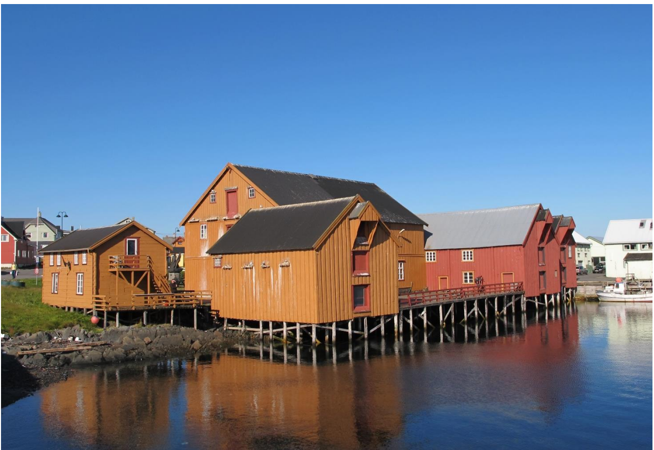
Sjøhus i Vardø. Vardø var den viktigste byen for pomorhandelen mellom Russland og Norge.

For de mange sjøhusene, saltebuene og større naust som ligger i LNFR områder (Landbruk, natur, friluftsliv og reindrift), setter Statlige planretningslinjer for differensiert forvaltning av strandsonen langs sjøen visse begrensninger. Retningslinjene har som formål å ivareta hensynet til natur- og kulturmiljø, friluftsliv og allmenne interesser i strandsonen. Det er et ønske fra mange grunneiere og kommuner om å tillate ny bruk av sjøhus, saltebuer og naust langs kysten, samtidig kan dette kunne gå på bekostning av miljø- og friluftsinnteresser. Handlingsrommet innenfor de ovennevnte planretningslinjene med tanke på å sikre bruk og vern av viktige kulturminner og kulturmiljø langs kysten, er ikke tilstrekkelig kjent.