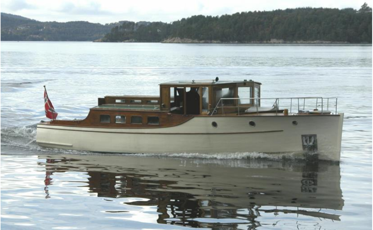
M/Y Fyk.

Fritidsbåter omfatter en rekke ulike fartøy bygget fra andre halvdel av 1800-tallet. I mange av de første regattaene var det bruksbåter som ble benyttet, men etter hvert ble det konstruert regattabåter, spesialbygde, kostbare kappseilere i kravell med stor seilføring. Utover på 1900-tallet dukket det opp billigere alternativ, seiljolla, som etter hvert ble et fast innslag på regattabanen.