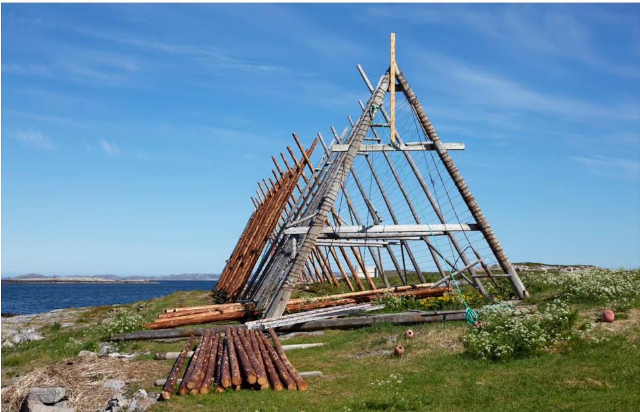
Fiskehjell, Sjørgjeslingan.

Deltemaet handler om naust, buer, brygger og fartøy som var fiskerens og fiskerbondens arbeidsmiljø. Fiske har i stor preget kysten med bygninger, anlegg, små og store båter og fartøy som til sammen danner verdifulle kulturmiljø. Det finnes også mange forhistoriske spor etter aktiviteter knyttet til kystrelatert bosetning, næring og erverv.