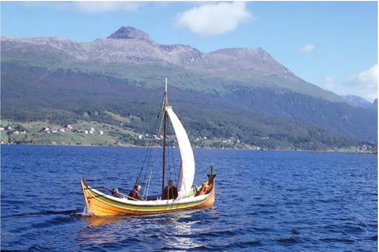
Nordlandsbåt for seil. Gratangen.