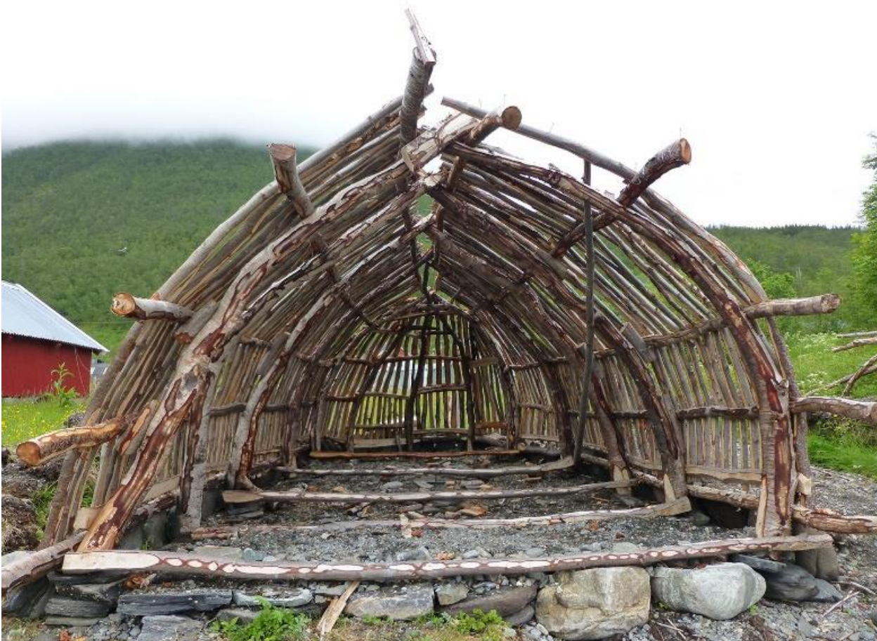
Nybygging av tradisjonelt sjøsamisk gammenaustr. Kåfjord kommune.

I kulturminnedatabasen Askeladden er det registrert flere enn 1100 nausttuffer som er automatisk fredet. Helt sentralt i samfunnsoppbyggingen stod Leidangen. Leidangsflåten fantes langs hele kysten og mange av leidangsskipenes båtstøer og nausttuffer er det bevart rester av. Disse er automatisk fredet og kan knyttes til tidlig organisering av en kystflåte allerede i middelalderen. Enkelte forhistoriske nausttuffer ligger også lengre inn på land, på grunn av landheving.