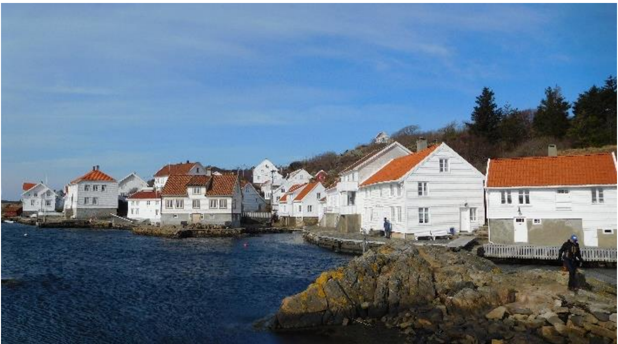
Uthavnen Loshavn i Farsund kommune.

Fartøy forfaller raskere enn kulturminner på land. De fleste fartøya i verneflåten er bygd med materialbruk og tekniske løsninger som krever kontinuerlig, og ikke bare periodisk, vedlikehold. Dette er en utfordring.