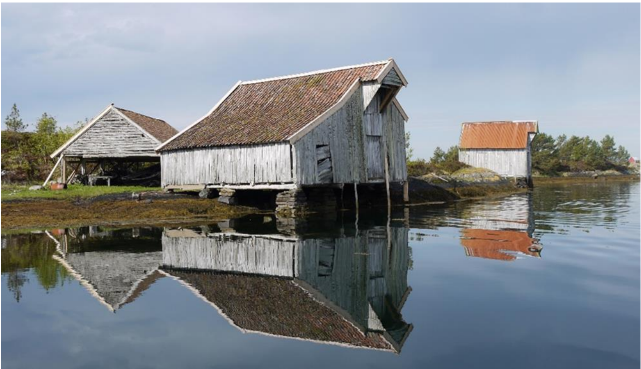
Naustmiljø i Flora kommune.

Naustet og sjøhuset var oftest en del av et større kulturmiljø. I tillegg til bygninger som naust og sjøhus omfattes også andre konstruksjoner som båtstøer, vorrer og ulike brygger og pirer. Ordet naust betyr "der båten står", og naustet med båt og utstyr kan sees som en funksjonell helhet.