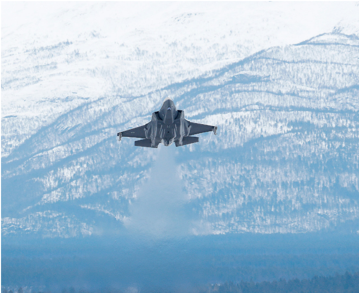
Flere miljø- og klimatiltak mangler finansiering og forankring i organisasjonen.