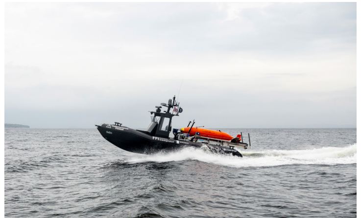
1. Forsvaret må se på evnen til høyintensiv strid mot russiske styrker i nord. 2. Mer internasjonalt samarbeid innenfor space er viktig. 3. «Lavkostnadsmissiler» kan være et supplement til systemer som NSM (bildet). 4. Teknologisk utvikling fortsetter å være viktig. FFIs ubemannede båt frakter AUV-en Hugin.

I Forsvarsanalysen 2024 bruker FFI hele sin faglige bredde til å gi forsvarsledelsen råd. Den ugraderte versjonen av analysen er den tredje i sitt slag. Den første kom i 2022. Analysen er et produkt fra FFIs prosjekt Strategiske forsvarsanalyser. Det ble opprettet i 2021, etter ønske fra forsvarssjefen. Forsvarsanalysen sammenstiller og videreutvikler analyser og resultater fra alle avdelinger ved FFI.