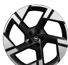
20-tommer (tilvalg GS)

Prisene er inkludert MVA og vrakpant, samt leveringsomkostninger, levert Halden.