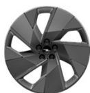
19-tommer (std. Edition)